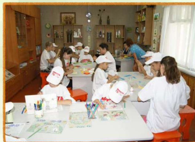
Помещения для занятий декоративно-прикладным творчеством