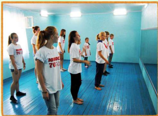
Помещение для занятий хореографией