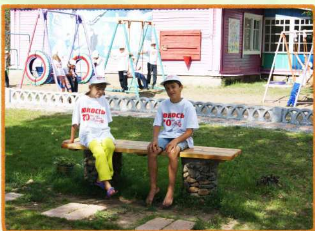
Детский городок, лавочки, скамьи, беседки, веранды, детский игровой комплекс «Два брата»