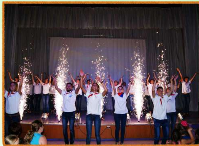
Концертный зал на 1000 мест, оснащенный современным светотехническим и звуковым оборудованием