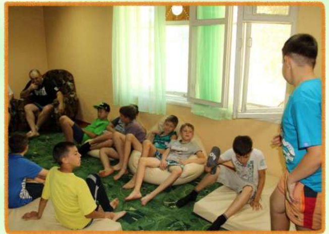
Комната психологической разгрузки