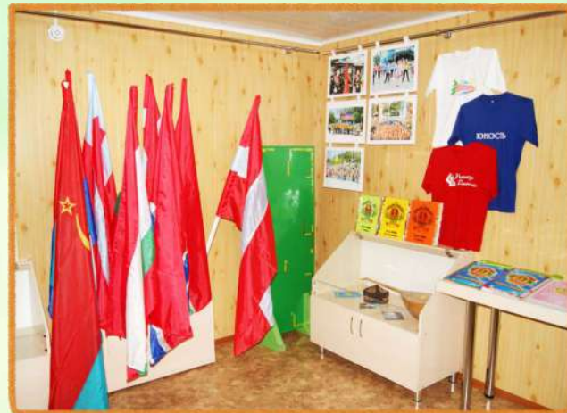
Музей истории лагеря, ежегодно пополняющийся новыми материалами