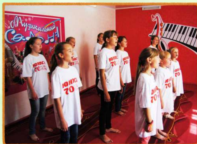
Зал для вокальных занятий